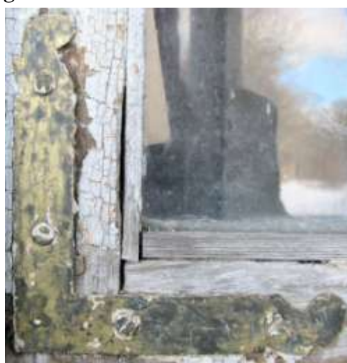
37. A5 nurgik.