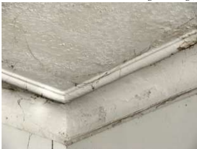
42. Peegelvõlvlagi ruumis nr 14.