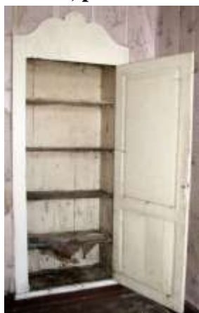
47. Seinakapp ruumis nr 2.

19. Seinakapp, uks, 2 hinged, riiulid, piirdelauad.