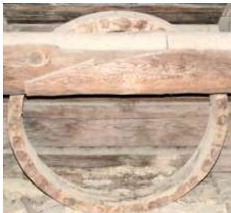
56. Ümarakna leng pööningul.