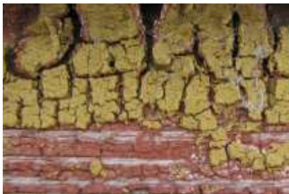
11. Viimistluskihid laudvoodril.

Välisseinte seisukord tundub visuaalsel vaatlusel olevat hea. Laudvoodri seisukord on rahuldav. Viimistluskihid irduvad. S-fassaadil vasakult 3., 5. ja 6. aknal puudub profileeritud veelaud. O-fassaadil sokli kohal paiknev veelaud osaliselt pehastunud, akna veelaud puudub. N-fassaadil puudub O-pool soklit kattev veelaud. W-fassaadil vahekarniis kahjustunud (1 laud puudub), soklit kattev veelaud puudub osaliselt.