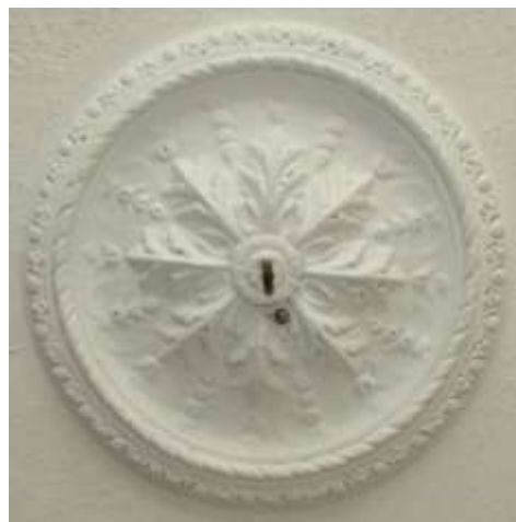
43. Laerosett ruumis nr 14.