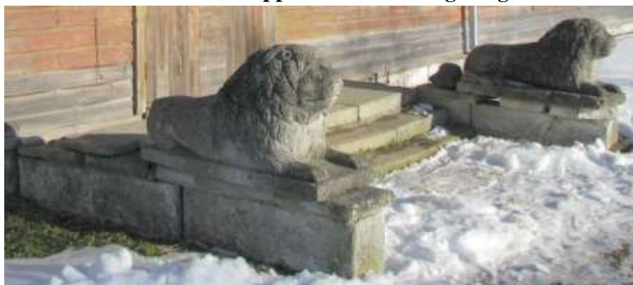
22. Trepp lõvifiguuridega.