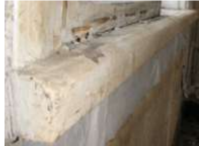
33. A4 aknalaud.