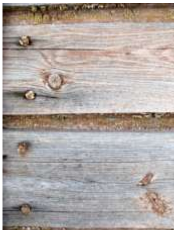
18. Laudis sepanaeltega.