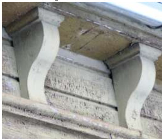
19. Räästaalused dekoratiivkonsoolid.