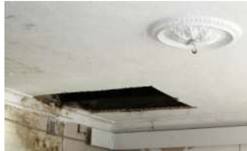
17. Ruum nr 14 lagi.