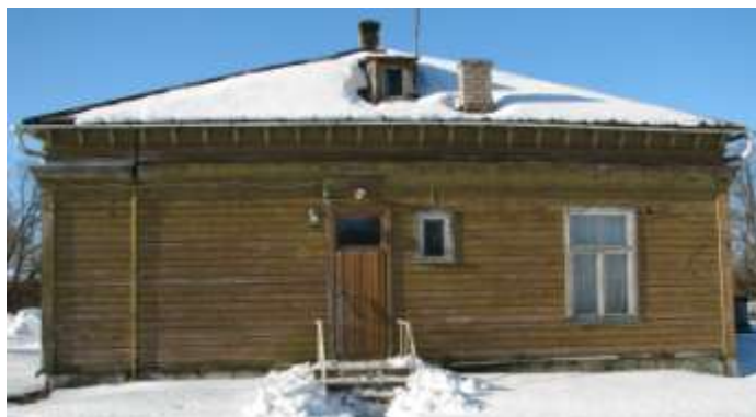
5. Vaade idast.