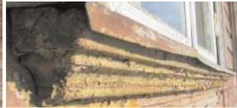
25. A1 profileeritud veelaud.

6. Leng, aknalaud, piirdelauad (sees ja väljas), 4 mantelhinge, 4 nurgikut, kremoon, õhuakna sulgur.