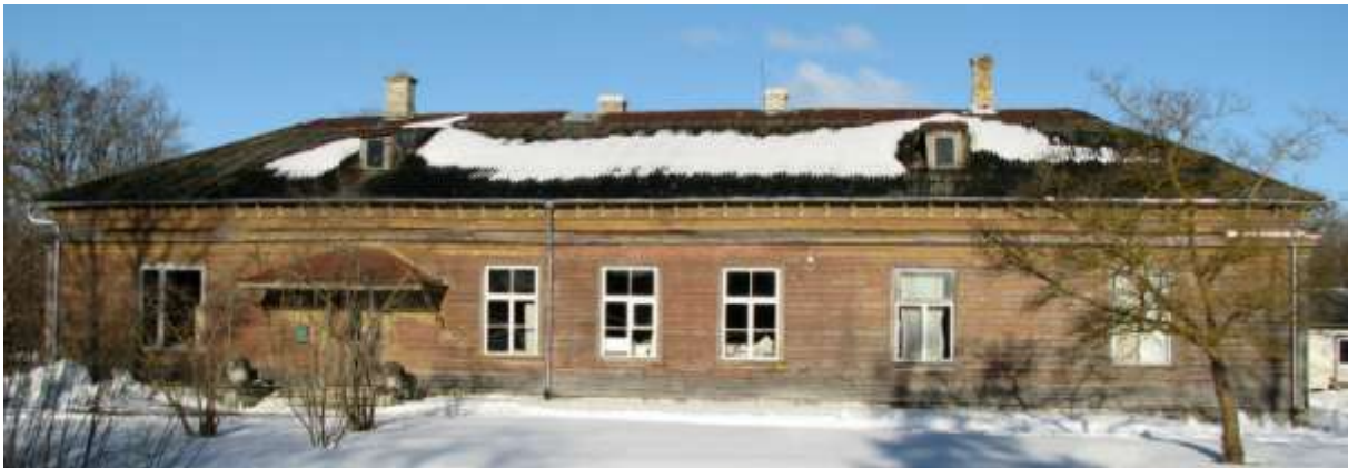
4. Vaade lõunast 2013. a.

Ümberehituste käigus muudetud ruumide planeering ei peegelda varasemat ruumilahendust. 5 (Lisa 2) Üksikutes N-poolsetes tubades on aimatav anfilaadne lahendus.