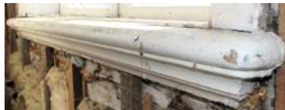
28. A2 aknalaud.

7. Leng, aknalaud, piirdelauad (sees ja väljas), veelaud, 4 mantelhinge, kremoon.