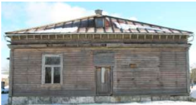
7. Vaade läänest.