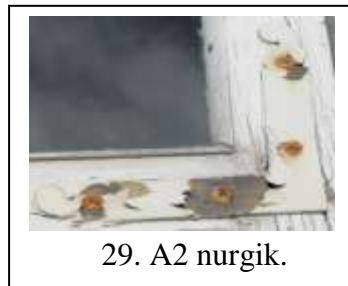
29. A2 nurgik.