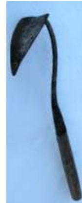
57. Kõblas (omaniku valduses).