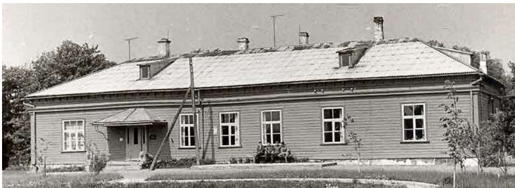
2. Vaade lõunast 1974. a.

Peahoone esifassaadile jääva väljaku tiik pärineb 1960ndatest aastatest. 3 Hoonet kasutati Nõukogude ajal koondise EPT ametiruumidena. 4 Samast perioodist pärinevad ka mitmed mõisasüdame territooriumil paiknevad tööstus- ja eluhooned ning sobimatud asfaltväljakud.