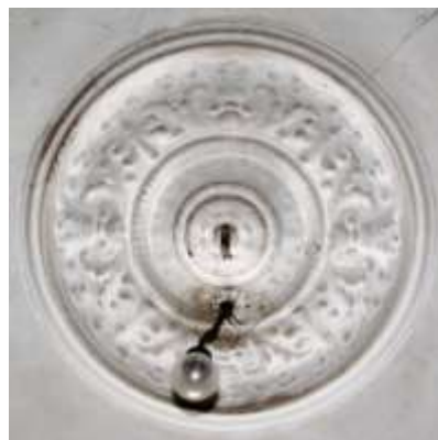
49. Laeroseett ruumis nr 1.

22. Leng, piirdelauad, uks, 2 mantelhinge.