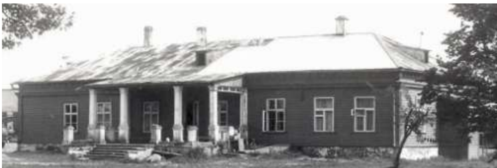
3. Vaade põhjast 1981. a.