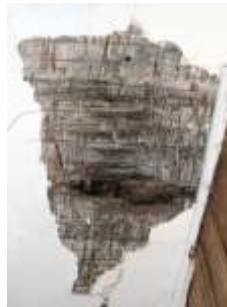
16. Krohivaring ruum nr 23 laes.