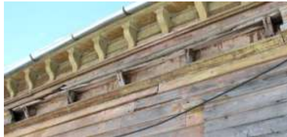
12. Kahjustunud vahekarniis.