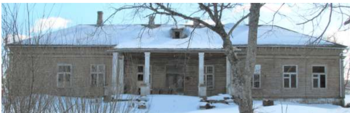
6. Vaade põhjast.