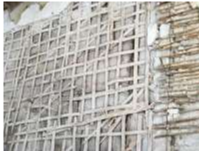
14. Rõhtpalkkonstruktsioonis sisesein krohvimattidega.