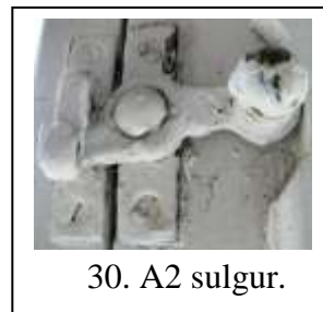
30. A2 sulgur.