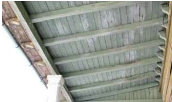
35. Veranda katusekonstruktsioon.