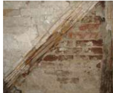
15. Vahvärk-tellis sisesein.