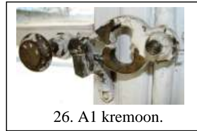
26. A1 kremoon.