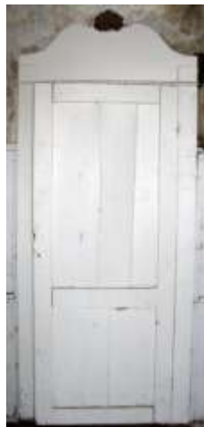
51. Seinakapp ruumis nr 23.

23. Seinakapp, uks, 2 hinged, riiulid, piirdelauad.