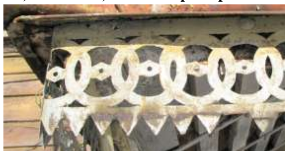
21. Varikatuse räästa plekkpits.