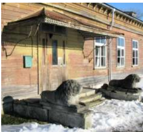
9. Peasissepääs lõunafassaadil.