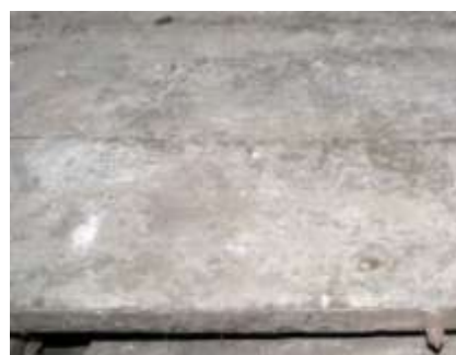
52. Laudpõrand ruumis nr 23.