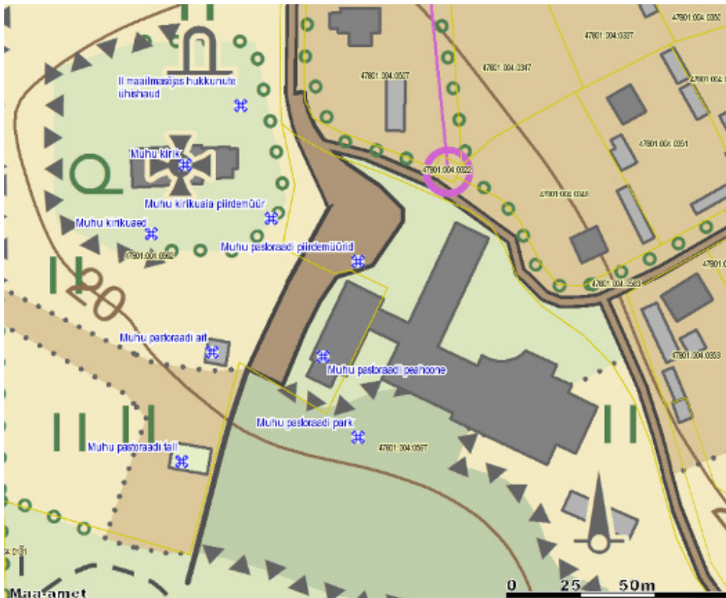
Kaart 1. Väljavõte Maa-ameti kaardiserveri kultuurimälestiste kaardikihilt.

Muhu pastoraadi peahoone on jäänud tänaseni ehituslikult seotuks Muhu põhikooliga, ajast kui pastoraat toimis veel kooli osana. Samuti asub Muhu pastoraadi park Hariduse kinnistul