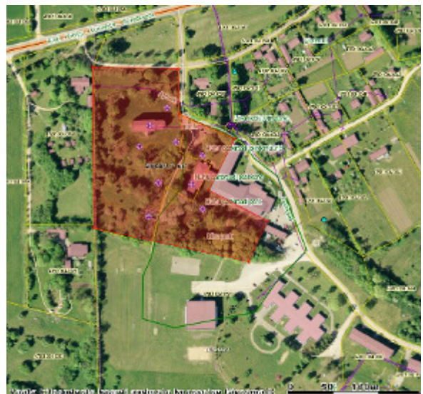
perspektiivne Liiva park