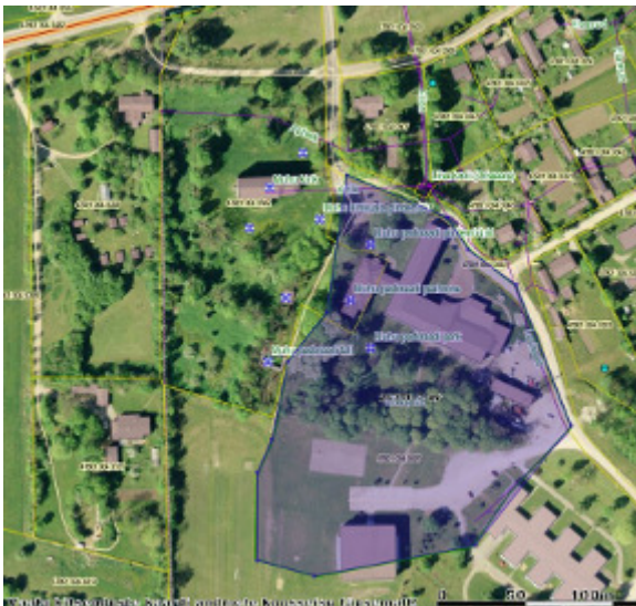
olemasolev Liiva park

Nimetatud projekt ja tegevuskava võimaldavad jätkata reaalsete ehitusinvesteeringute võimaluste planeerimise ja realiseerimisega.