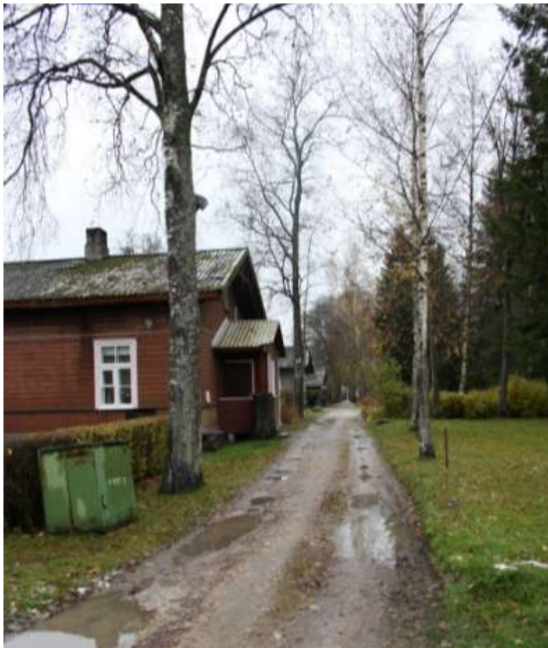
Väikekaskedega allee ehk sea- allee.