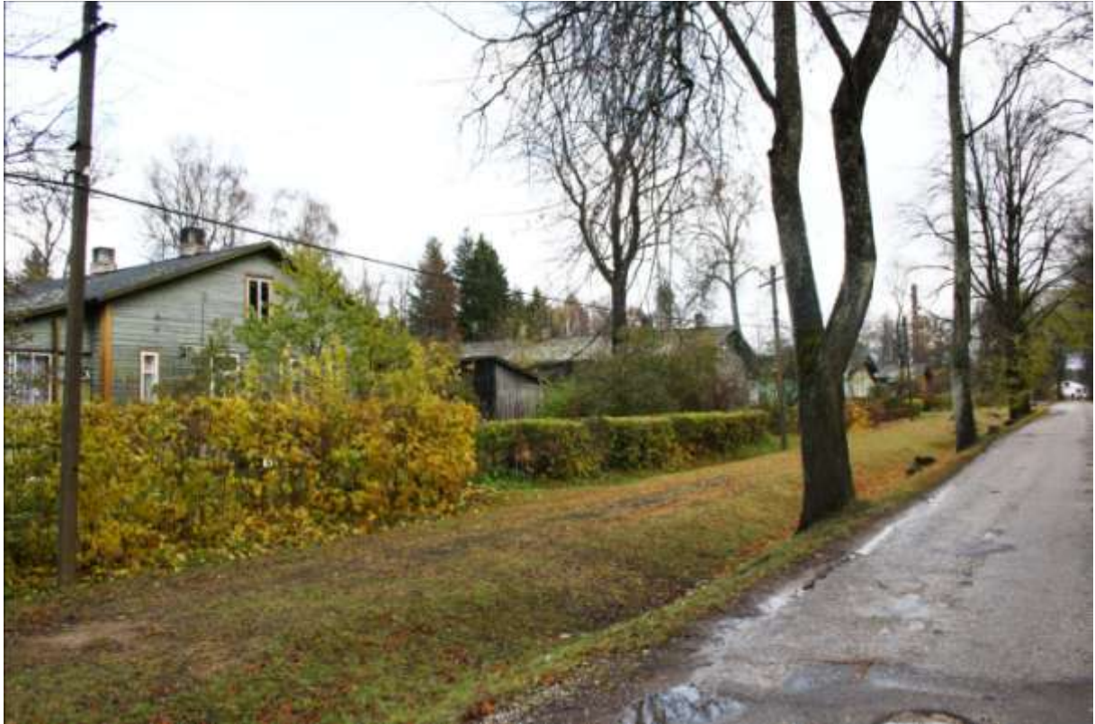
Vabriku puiestee. Suure allee jalakäijate osa on muudetud haljasalaks, hobutee on asfalteeritud. Säilinud on allee üksikud pärnad.