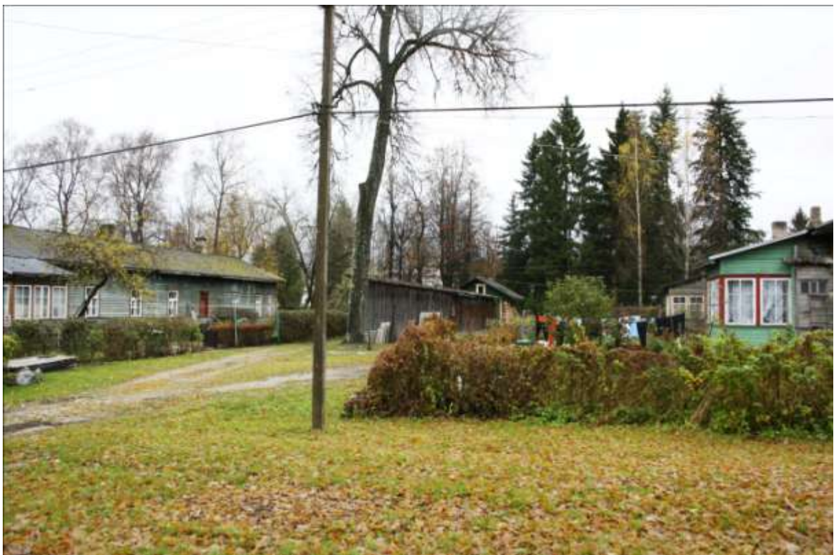
Tööliselamute miljöö Vabriku puiesteel. Elamute ees on heki või taraga piiratud eesaiad, elamute vahel asetsevad pikad kuurid ja käsipumbaga kaevud.