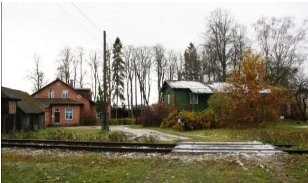
Vaade direktori elamu ja jääkelder-elamu poole üle endise majandushoovi ja vabrikusse viiva raudteeharu.