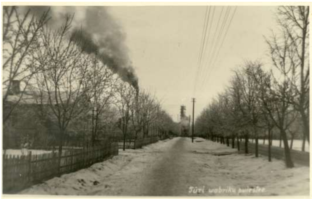
Vabriku puiestee.

Suurest alleest lõunas, vabriku poolses otsas paiknes kõrgemate ametnike elamu (12) koos ilu- ja tarbeaiaga. Selle naabruses asus teine kelpkatusega ametnikeelamu (13). Viljandi tee 5-7 kohal asunud heinaküünist ehitati ümber seltsimaja-õllesaal (1904.-1924.), see toimis nii vabriku tööliste kui ka teiste Türi elanike meelelahutuskohana.