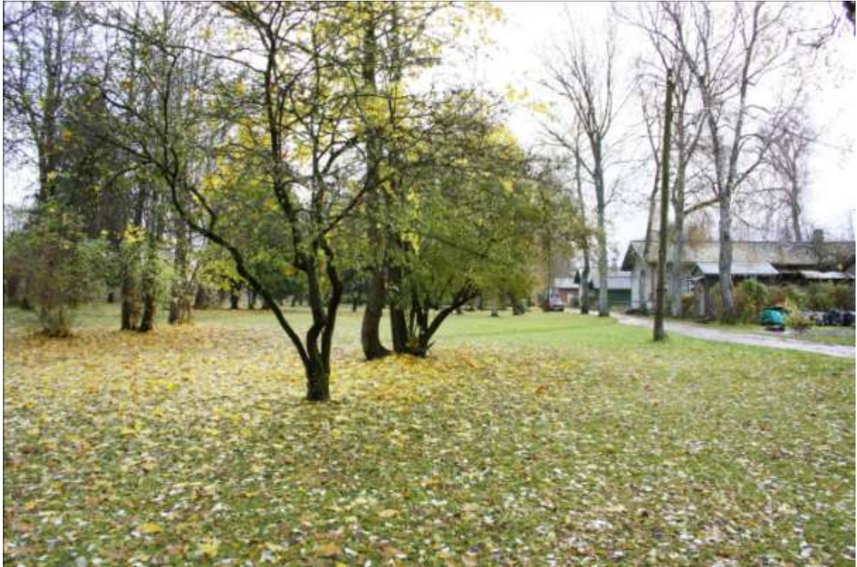
Vabrikuküla endine juurviljapõld, nüüd park.