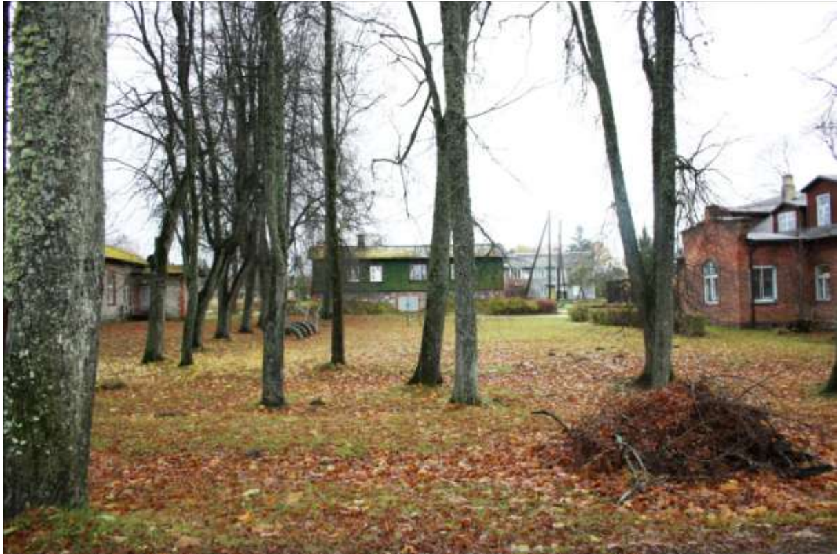
Direktori elamu, jääkelder-elamu ja ametnike elamu vaheline park, endine tenniseväljak.