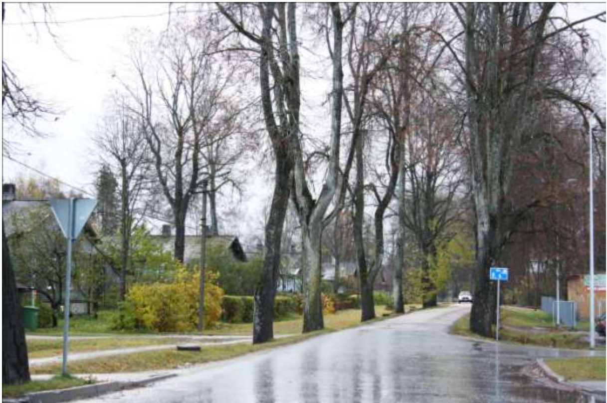
Vabriku puiestee, Viljandi teelt pildistatuna

-Olaf Prints, Türi linn ja paberivabrik., Tartu 2002.