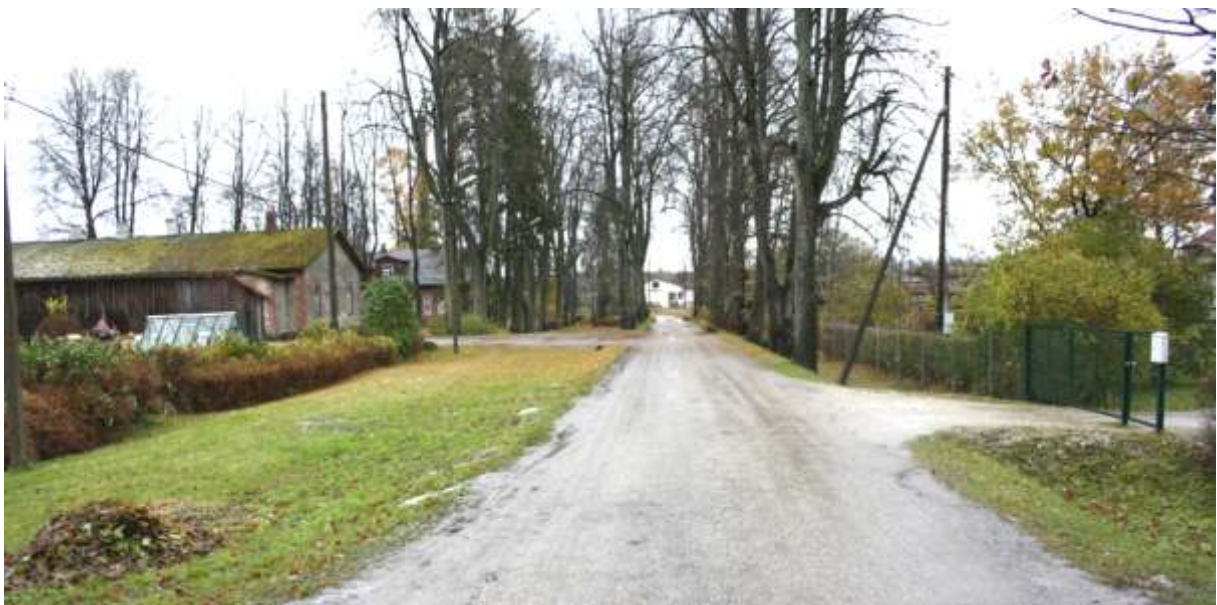
Vabriku puiestee algus. Otse paistavad vabriku hooned, paremal kõrgemate ametnike elamu värav.