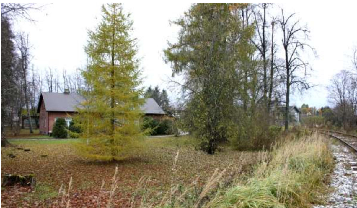
Direktori elamu esine park ning seda piirav raudteetamm.