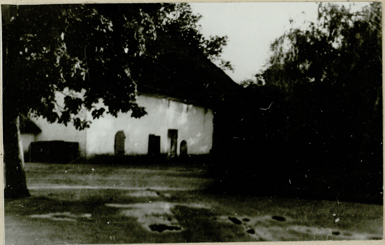
FOTOGRAFIE V. J. 1860