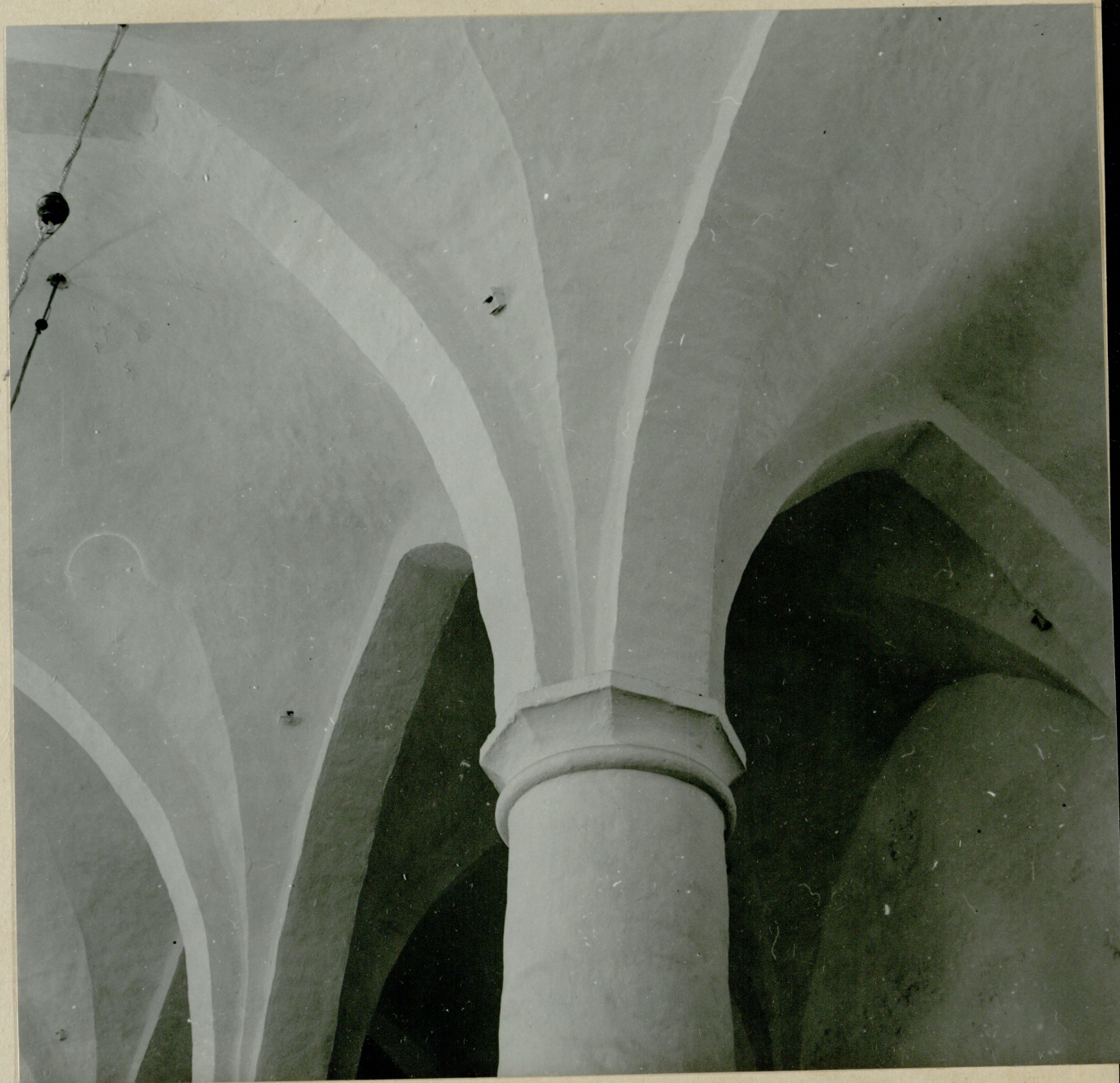
11. Motiiv kiriku interjöörist. Ehitajate võlvimiskunsti kõitev näide. N-15259