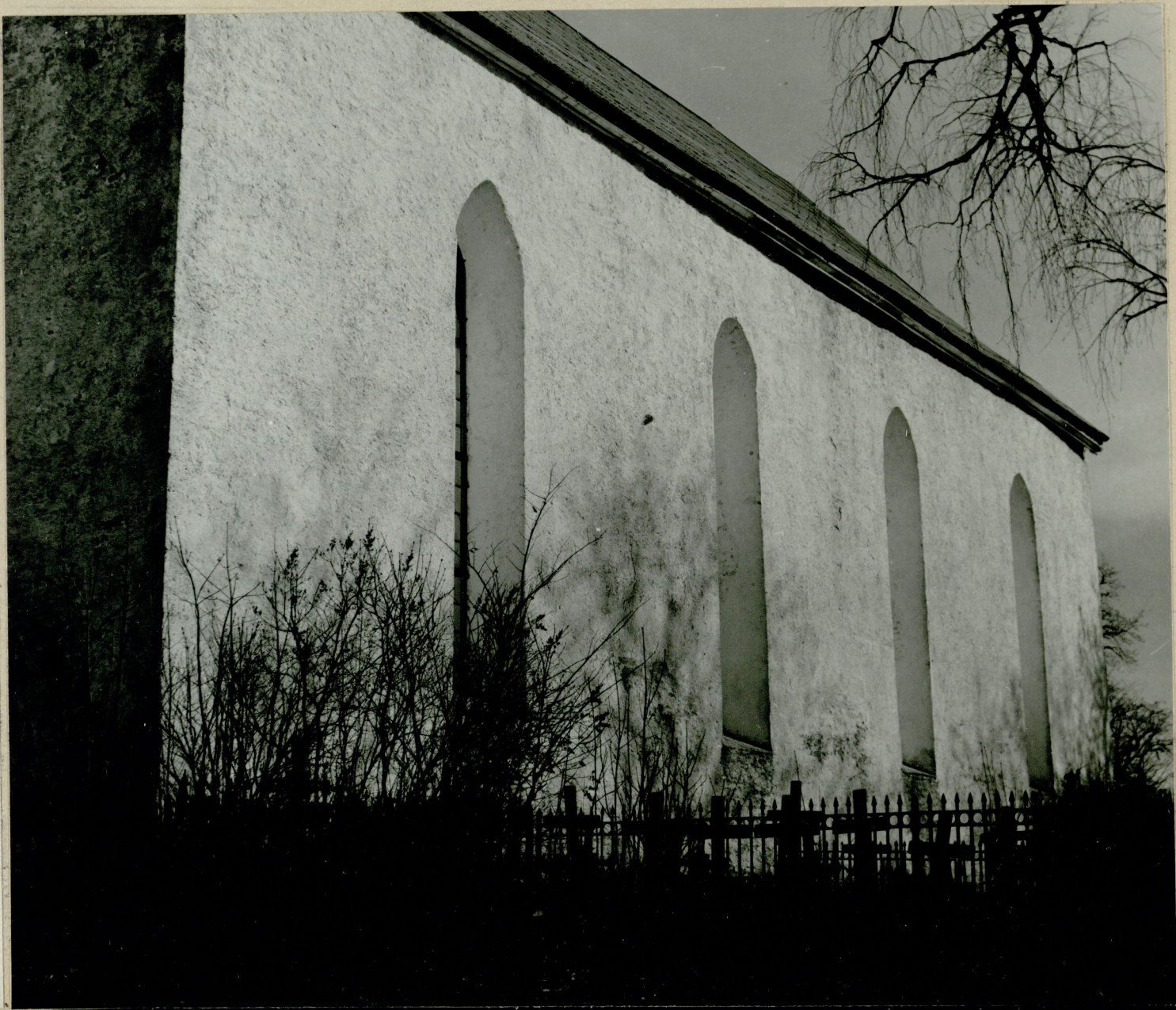
2. Kiriku pikkhoone lõunasein välisvaates. Ainulaadse pikkuse ning monumentaalsusega maalikirik Eestis. Vasakul Iokkama löönud võsa, viltnu vajunud ehised ja kolkjäl järvä-Pee trilla tseloomulikkud tamedad metalliristid (neist enamik azuurised). W-15255