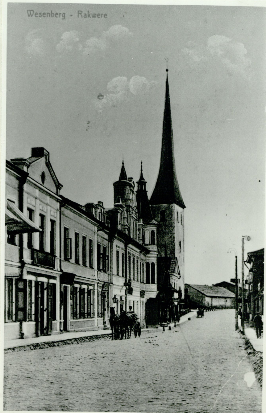
Wesenberg - Rakvere