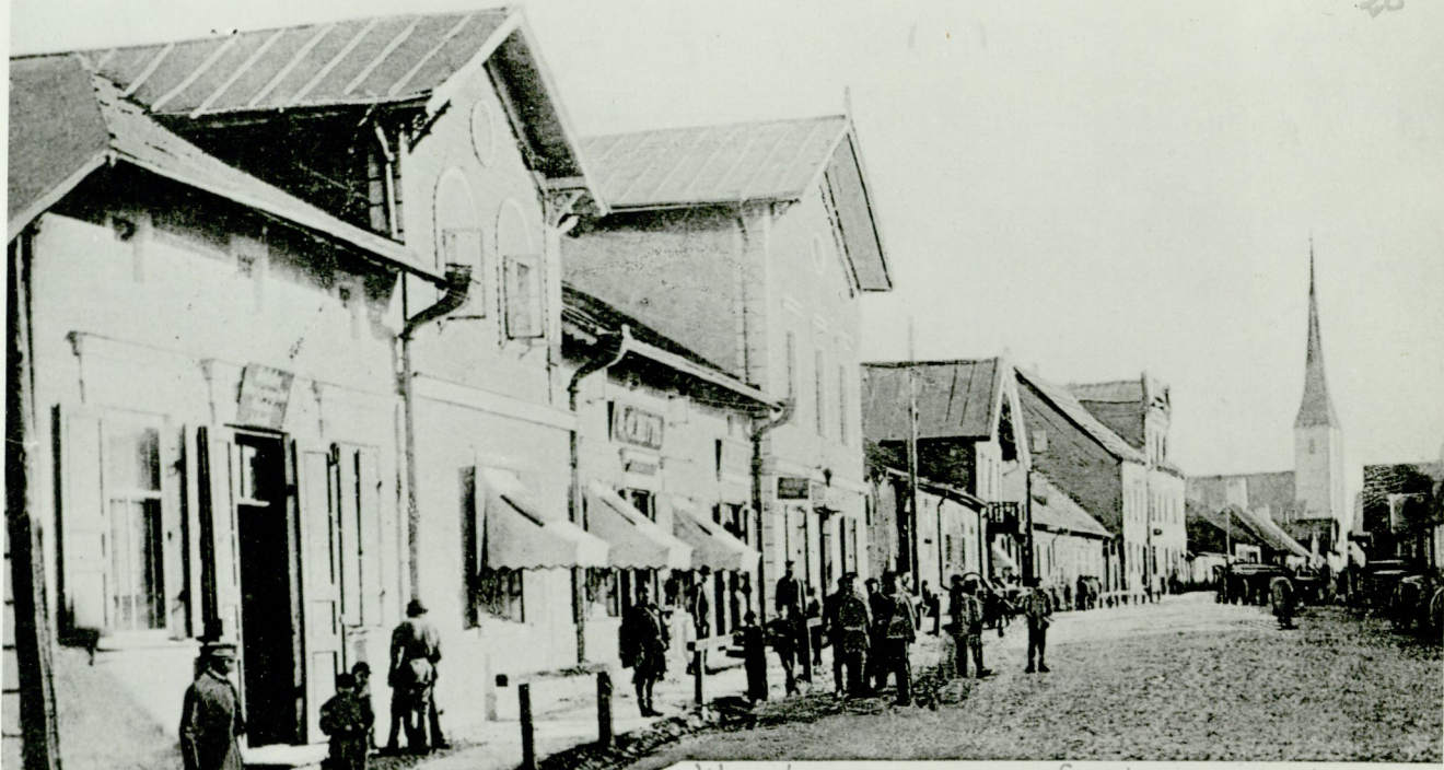
Wesenberg. Langstrasse. Größe, Höhe, Preis Jüngere von mir.