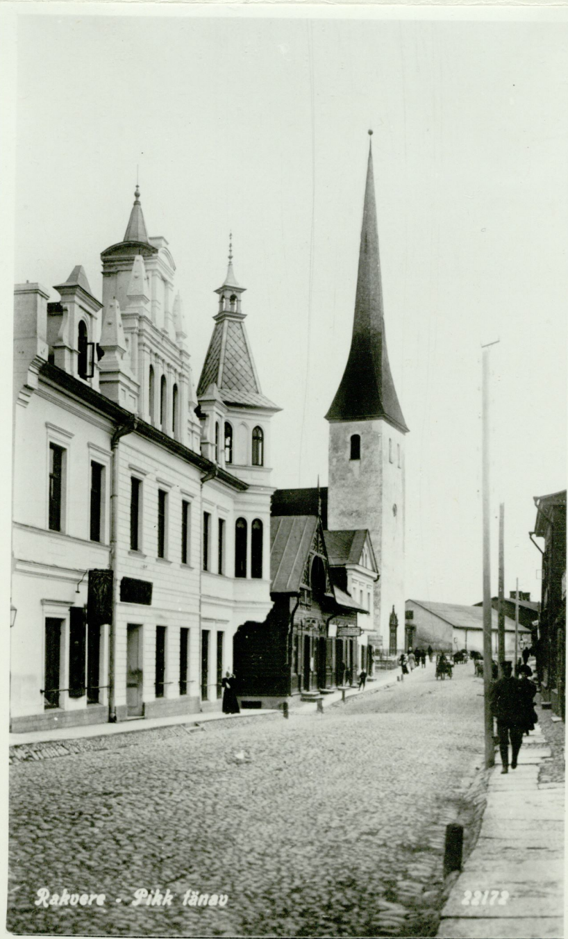
Rakvere - Pikk tänav