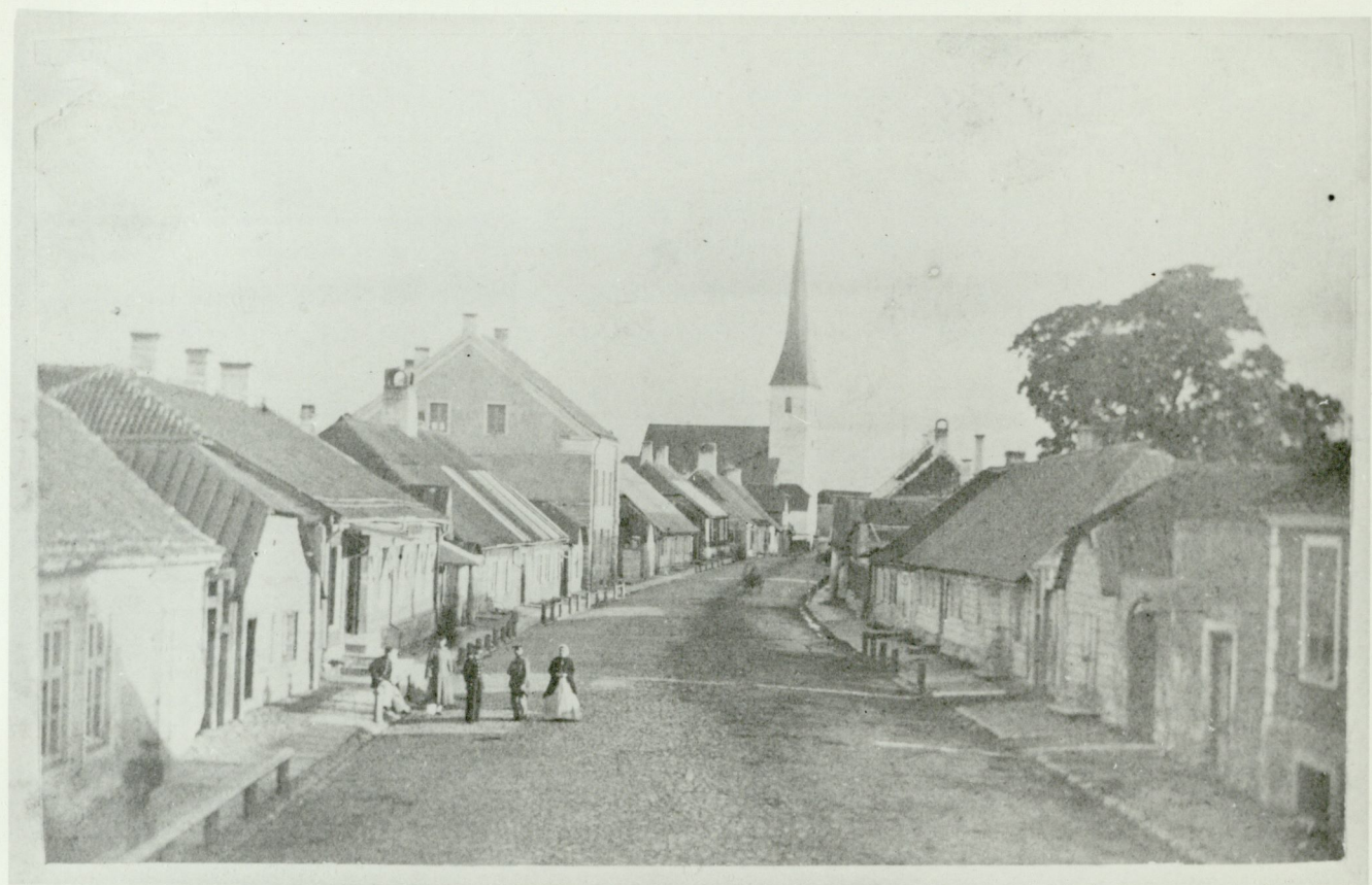
Rakwere - Pik uul. - Wesenberg - Lang-Str.