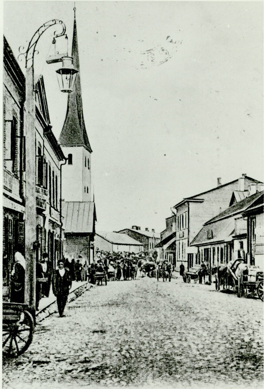
Gruss aus Wesenberg