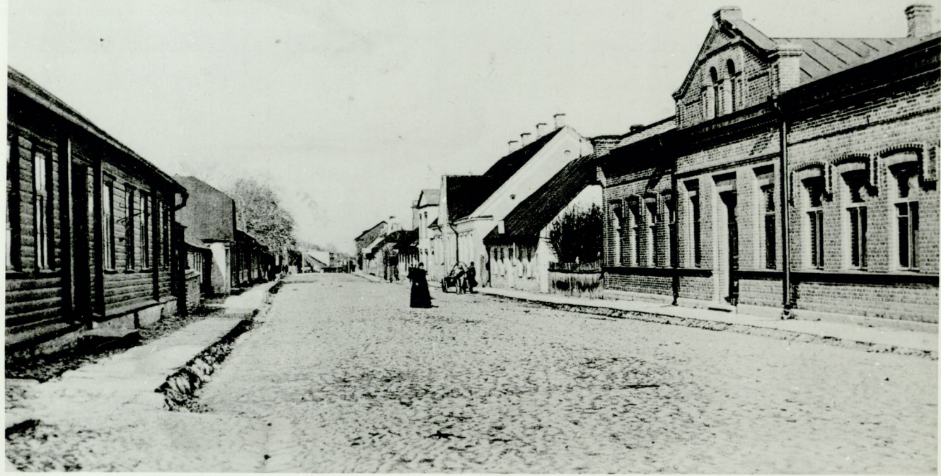
Wesenberg — Rakvere.