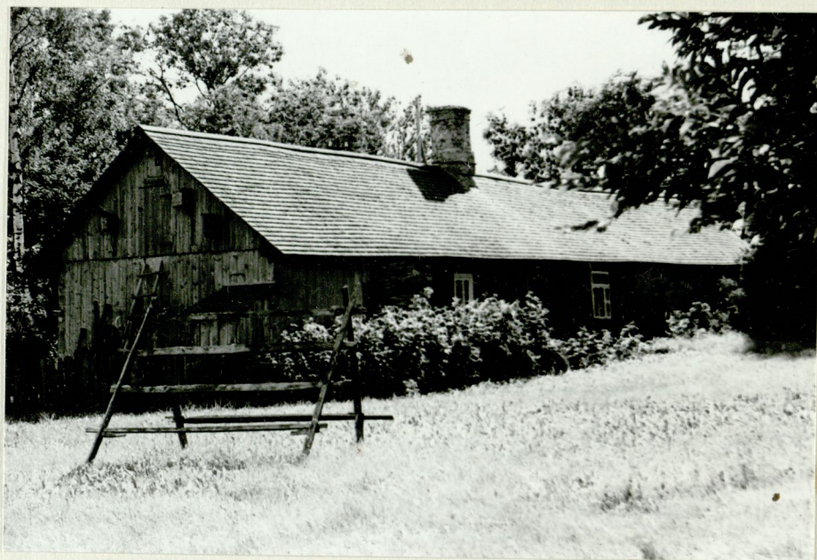
Vahtraja kōrts, Saarekülg