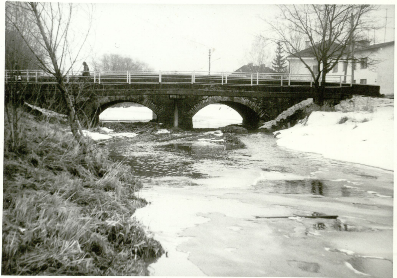
Foto 1. Rapla sild. Vaade loodest. Foto A.Hein, aprill 1980. KRPI neg. N-20414/2.