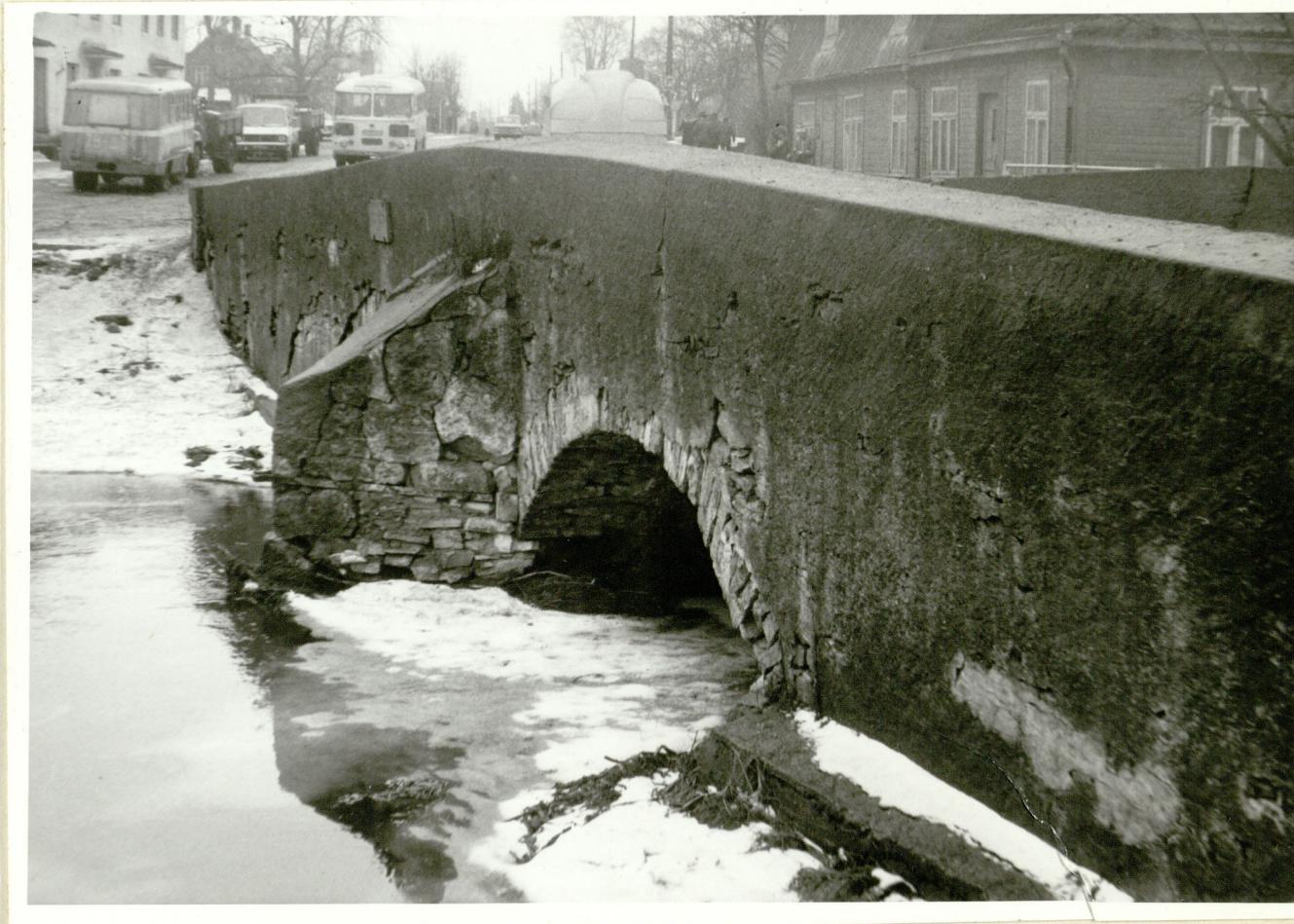
Foto 2. Rapla sild. Vaade silla idaküljele. Foto A.Hein, aprill 1980. KRPI neg. N-20414/4.