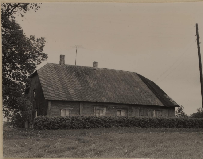
Prümlü möis. Peahoone esikülg.