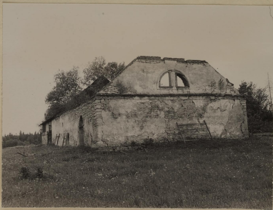
Raka mõis. Ait.