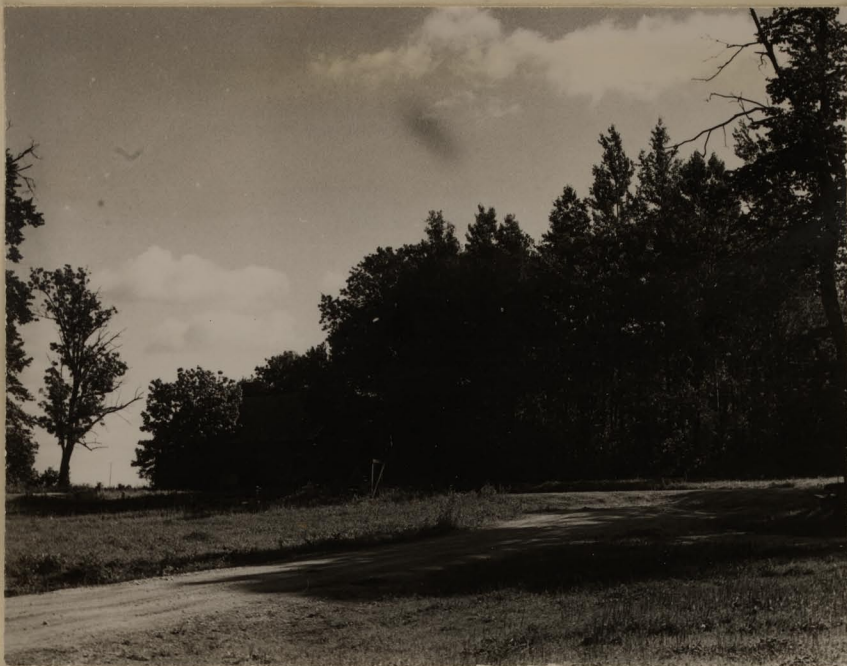
Kivijärve mõis. Peehoone ase.