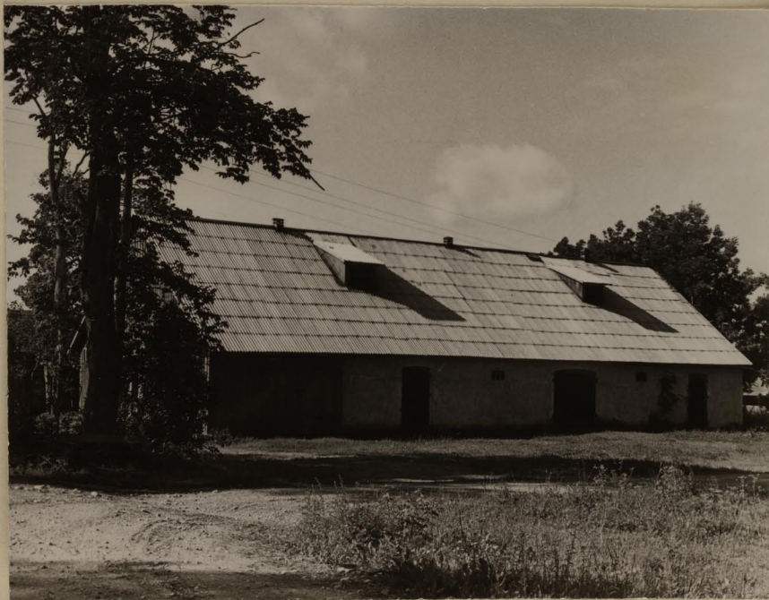
Kivijärve mõis. Ait ?