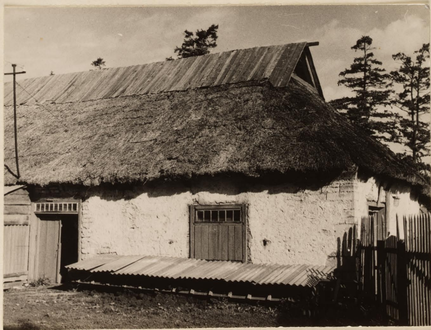
Rannakilla mõis. Peehoone ase.